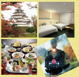
圖為霞水、安城湖觀光

位於日本正中央的群馬縣，從東京出發搭乘新幹線約55分鐘即可到達，縣內擁有463處溫泉，儼然是日本溫泉的代名詞。現在加入「東日本鐵道假期」粉絲團，免費最喜歡的群馬縣觀光活動，即可參加抽獎活動，有機會體驗東日本鐵道假期，免費到群馬縣享受泡湯樂！詳情請瀏覽： http://fb.idjw.com/30044